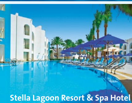
Stella Lagoon Resort & Spa Hotel