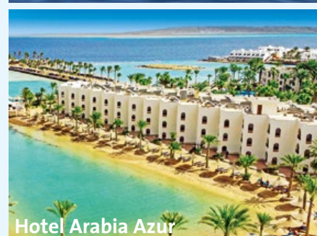
Hotel Arabia Azur